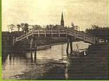
Kwakelbrug tussen de Rijksstraatweg en de Delft, gezien naar het oosten, in de verte de Sint Bavokerk, 1921.

afwateringsvaart. Tot in de vorige eeuw werd hij druk bevaren door vrachtboten, die zoden, turf of groenten vervoerden van het Spaarne naar de losplaatsen langs de vaart. Schoten was tot aan de jaren twintig van de vorige eeuw een echte boerengemeenschap en bestond voornamelijk uit weiden en velden. De bebouwing van dit dorp concentreerde zich langs de Rijksstraatweg. In 1927 werd Schoten geannexeerd door Haarlem.