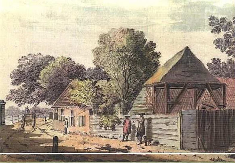
Het Schoterbruggetje, met links de entree van het landgoed Spaarnrijk, aquarel van Hendrik Tavernier, 1776.