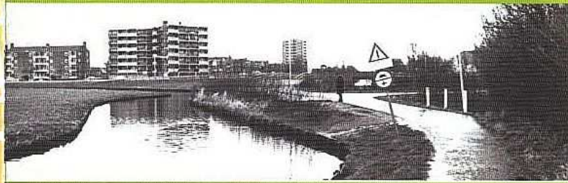
Het Schoterkerkpad, met de bebouwing aan de Delftlaan, rond 1980.

De wegen van en naar Haarlem liggen vanouds voornamelijk in noord-zuidrichting. Er zijn betrekkelijk weinig oost-west georiënteerde wegen en paden. Onder deze dwarsverbindingen zijn een paar fraaie, rustige routes die heel geschikt zijn als recreatieve routes voor fietsers en wandelaars. Het is van groot belang dat deze verbindingen worden behouden, verbeterd of in ere hersteld. Het Jan Gijsenpad voert van het Noorder Buiten Spaarne door Haarlem-Noord naar de binnenduinrand.