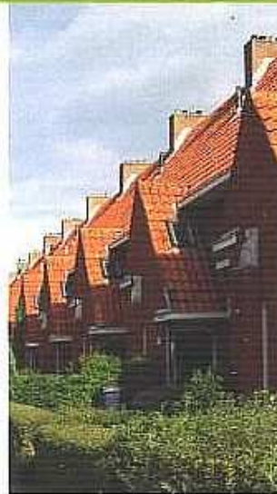
Woningen aan de Jan Gijzenkade bij de Eemstraat, gebouwd voor woningvereniging St. Josef.

Voorbij de Delftlaan betreden we Santpoort-Zuid en begint het Schoterkerkpad ⑭, dat zich langs de Jan Gijzenvaart uitstrekt. Voetpad en fietspad zijn van elkaar gescheiden door een zoge-