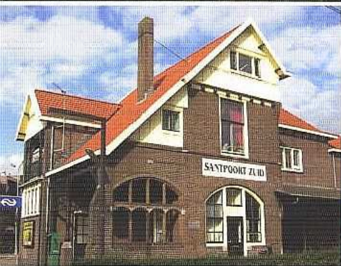
Het Schoterkerkpad, gezien naar het westen (boven), en het station Santpoort-Zuid uit 1899.

naamde Zeeuwse haag, die bestaat uit een duurzame combinatie van veldesdoorn en meidoorn. Vroeger heette dit pad in de volksmond ook wel Zwartepad, vanwege de sintels waarmee het bestrooid was. Dicht bij het station Santpoort-Zuid 15 ligt het begin van de vaart, hier Jan Gijsenvaart geheten. Het station is in 1899 gebouwd naar ontwerp van de architect D.A.N. Margadant, die ook voor het station van Haarlem tekende. Ooit liep de vaart verder door richting Bloemendaal, maar aan het begin van de 20ste eeuw werd het gedeelte langs de Bloemendaalsestraatweg gedempt om woningbouw mogelijk te maken.