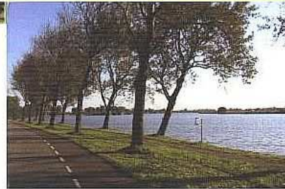
Het Noorder Buiten Spaarne, gezien vanaf de Spaarndamseweg.

De weg is aangelegd op een strandwal, een onderdeel van een complex van zandruggen, evenwijdig aan de kust. De